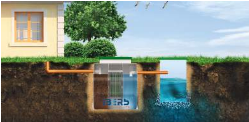
При песчаных грунтах и при низком уровне грунтовых вод (1,5 м и ниже) в дренажный колодец