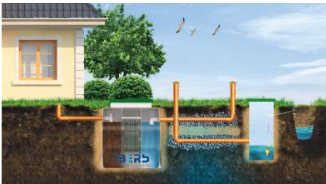
При низкой пропускной способности грунта (глина, суглинок) и высоком уровне грунтовых вод – в приёмный колодец