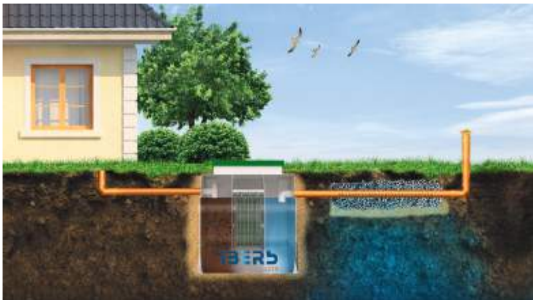
В песчаных грунтах при низком уровне грунтовых вод в дренажную трубу