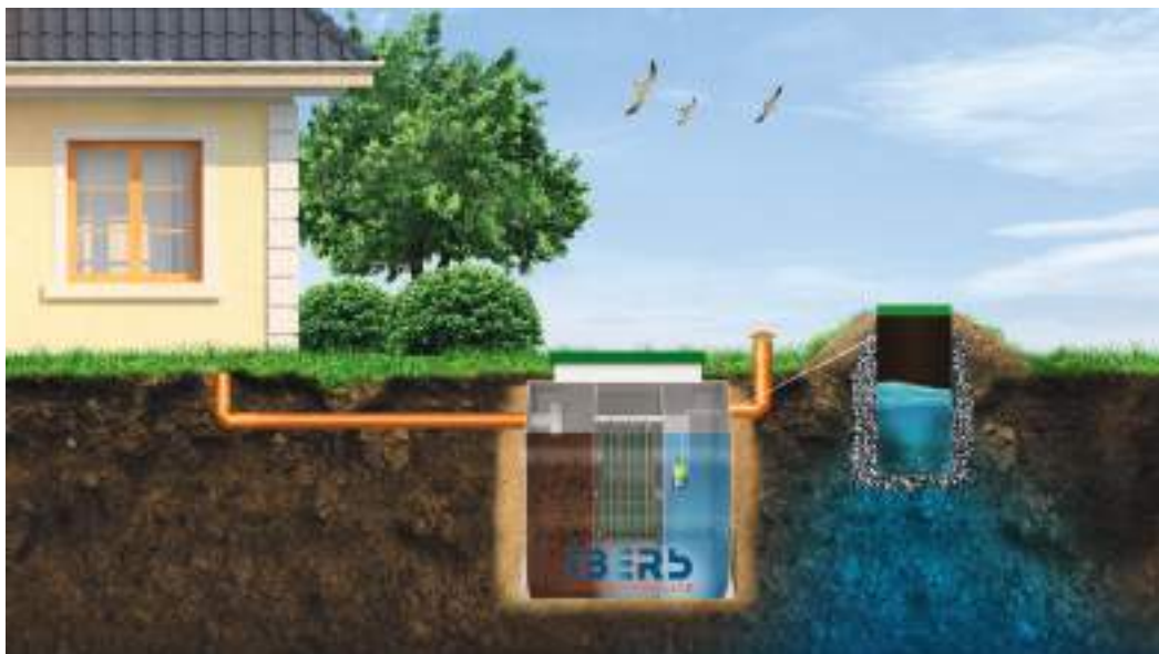
При высоком уровне грунтовых вод с насосным отсеком в альпийскую горку